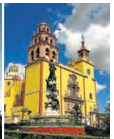
Escenas urbanas. Abajo a la izquierda, catedral de San Miguel de Allende. En el resto de fotografías, vistas de Guanajuato, durante la celebración de La Catrina Vive.