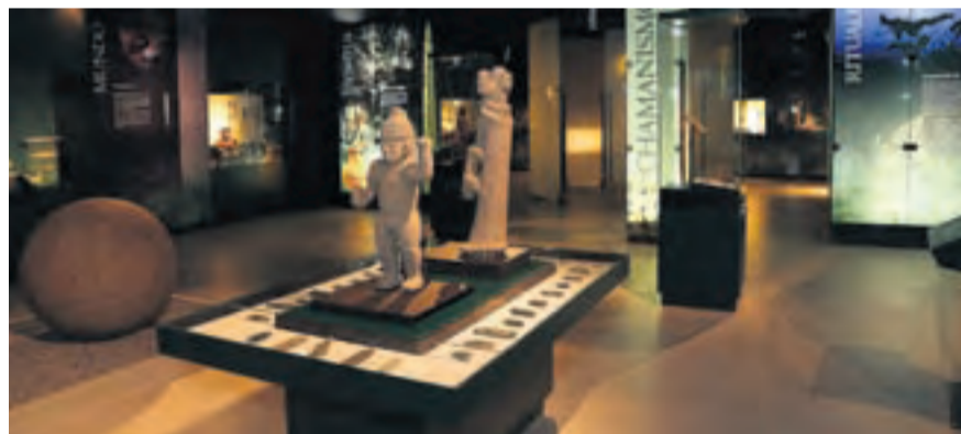
Naturaleza y tradición. Tramo del río Celeste, que adquiere tonos turquesa; un plato de cocina tradicional; la exposición en el museo de Jade, en San José; y la Fiesta de los Diablitos.