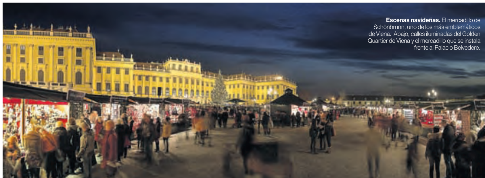
Escenas navideñas. El mercadillo de Schönbrunn, uno de los más emblemáticos de Viena. Abajo, calles iluminadas del Golden Quartier de Viena y el mercadillo que se instala frente al Palacio Belvedere.

Más de 8 millones de personas visitaron el año pasado alguno de los múltiples mercadillos navideños del adviento vienés