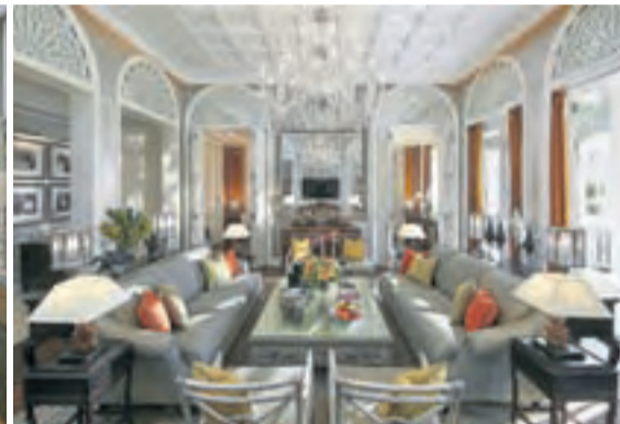
+ Elegancia. Imagen de los jardines y de algunas zonas interiores remodeladas.