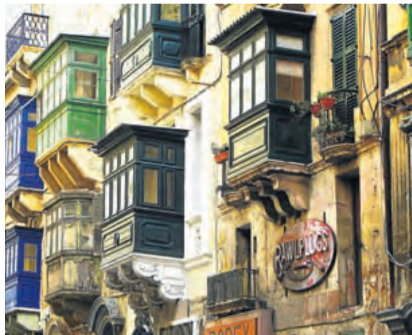
Para retratar. Vista de La Valeta desde el mar; imagen cenital de la ciudad amurallada de Mdina, y vistosos balcones ( gallarijas ) típicos de la arquitectura tradicional maltesa.

colorida muestra de estos genuinos miradores.