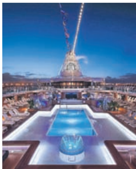
Lujo. Piscina de un barco de Oceania Cruises.

De todos los placeres que Oceania Cruises ofrece a bordo, quizás los más reconfortantes son sus lujosos camarotes, un oasis privado de bienestar en el que descansar y relajarse. Tienen servicio de habitaciones las 24 horas, artículos de baño de Bvlgari y refinado chocolate belga cada noche. Las suites cuentan con balcón privado, sala de estar y baños de mármol con bañera, mientras que las Grandes Suites incorporan toques exclusivos de lujo con muebles italianos hechos a medida y auténticas maravillas de la mano de Ralph Lauren. Otro de los platos fuertes de Oceania Cruises es una gastronomía selecta: hasta seis restaurantes de altísima calidad sin cargo alguno se pueden encontrar en el barco,