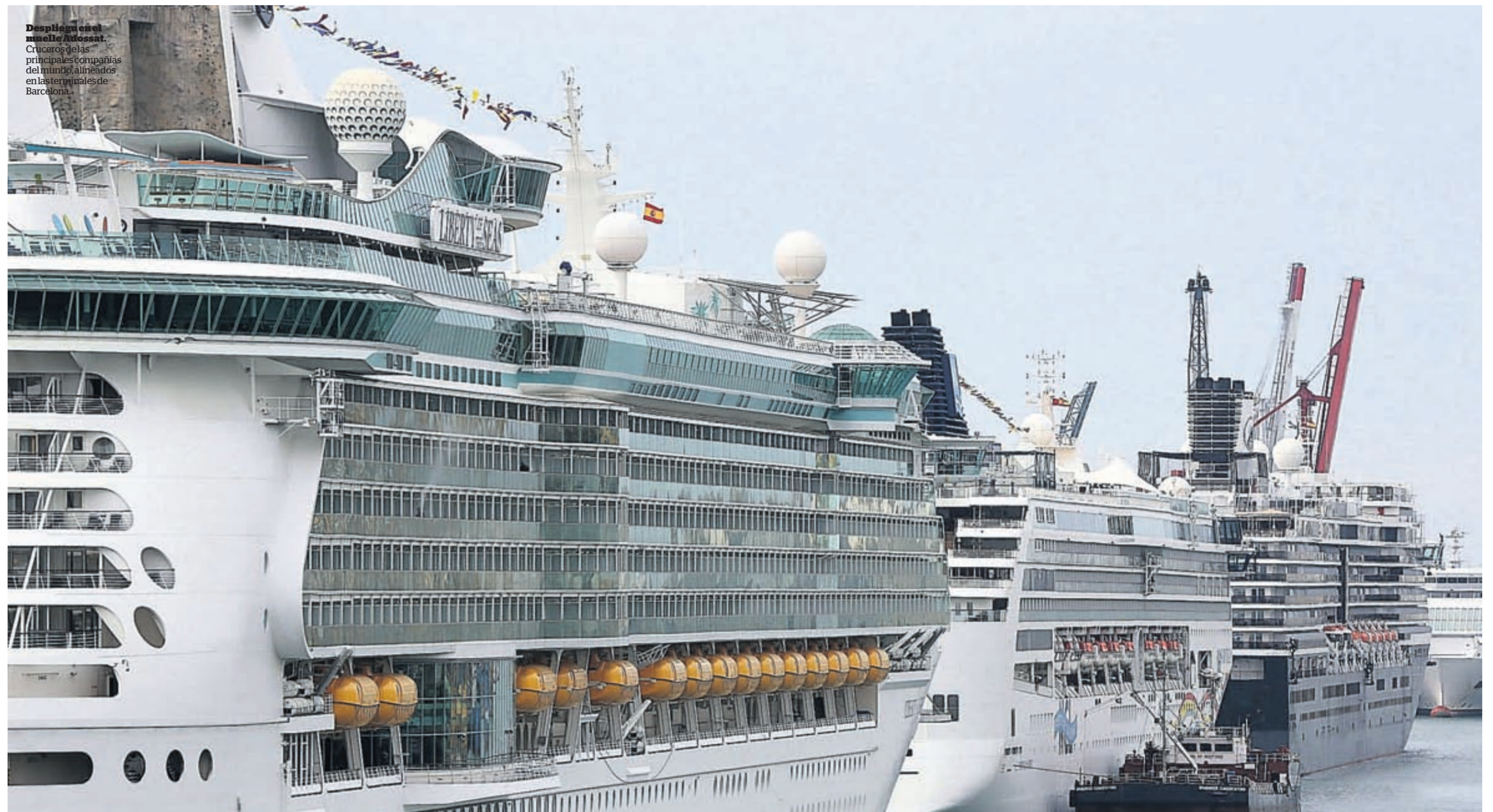
Desfile en el muelle Adossat. Cruceros de las principales compañías del mundo, alineados en las terminales de Barcelona.

batalla para que el pastel quede repartido, sin días de saturación. En el 2015 el día punta fue el domingo 13 de septiembre con 26.770 pasajeros, la mayoría de los cuales empezaban y acababan su viaje en Barcelona. Un análisis realizado por este diario ya constató que estos viajeros se distribuyen más allá de la capital, porque al disponer de varios días realizan excursiones y visitas muy diversas. Por el contrario, los pasajeros de escalas de solo unas horas viven la ciudad de una forma más intensiva en su centro histórico. En conjunto, la ciudad absorbe unos 6.800 cruceristas al día, con una minoría en escala, y que en pocas ocasiones hacen visitas por su cuenta a partir de la Rambla.