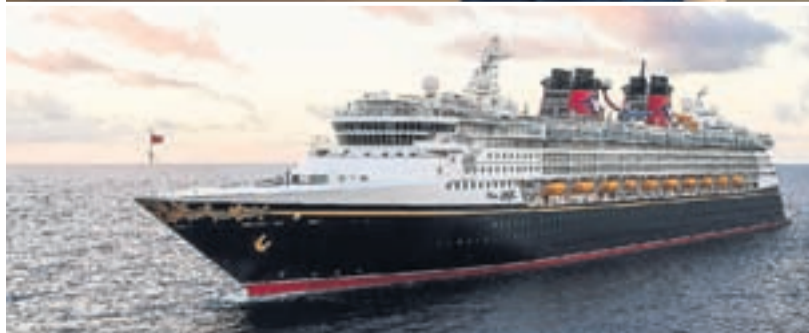
Un mundo de fantasía. El popular Mickey (arriba) y el Disney Magic en plena travesía.

y la calidez del país con paradas llenas de historias de los vikingos.