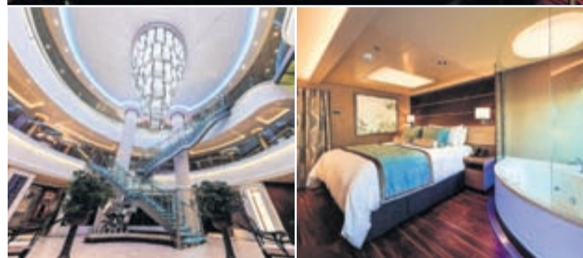
Confort. Vista exterior y diversas estancias del Norwegian Escape .