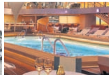
Arriba, el Sirena . Debajo, el Harmony en construcción y la piscina del nuevo Encore .

un formato íntimo y detallista. No faltarán sus restaurantes de especialidades sin cargo, camarotes modernos pero elegantes y servicio upper premium . En este caso, el debut será en la capital catalana, con rutas mediterráneas en verano, y en el Caribe y Sudamérica en invierno.