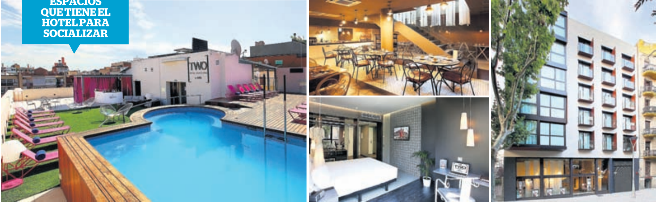
+ Cuidada decoración. Imagen de la piscina, la sala del desayuno, una de las habitaciones y fachada del Two Hotel Barcelona by Axel.

LA TERRAZA ES UNO DE LOS ESPACIOS QUE TIENE EL HOTEL PARA SOCIALIZAR