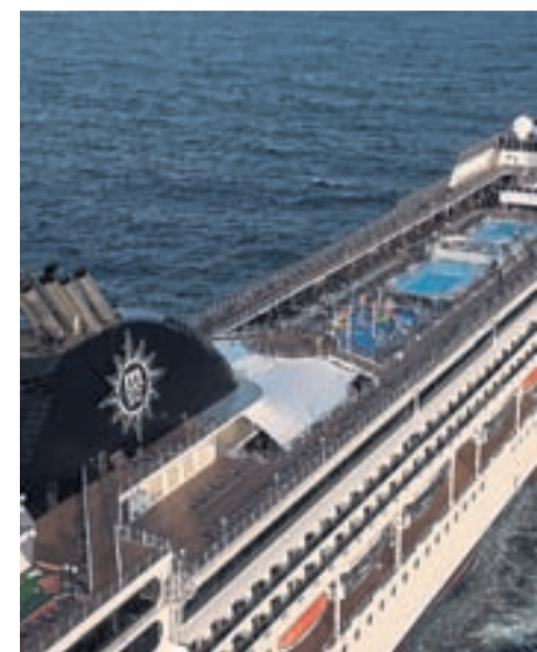
Diversidad. Cubierta del MSC Opera .

Ya en temporada regular, antes de empezar la navegación por el Caribe, los pasajeros del MSC Opera podrán explorar el impresionante casco histórico, patrimonio de la humanidad. En la isla de Cozumel, en la península de Yucatán, verán espectaculares ruinas mayas en Tulum, así como practicar esnórquel para ver las tortugas