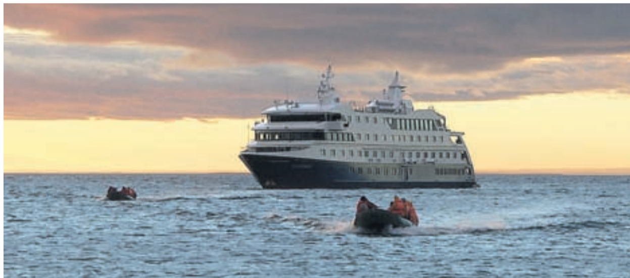
Expedición. El Stella Australis (arriba) y el Via Australis navegan por las aguas de la Patagonia.

DURANTE EL VIAJE SE LLEVAN A CABO EXCURSIONES CON GUÍAS EXPERTOS