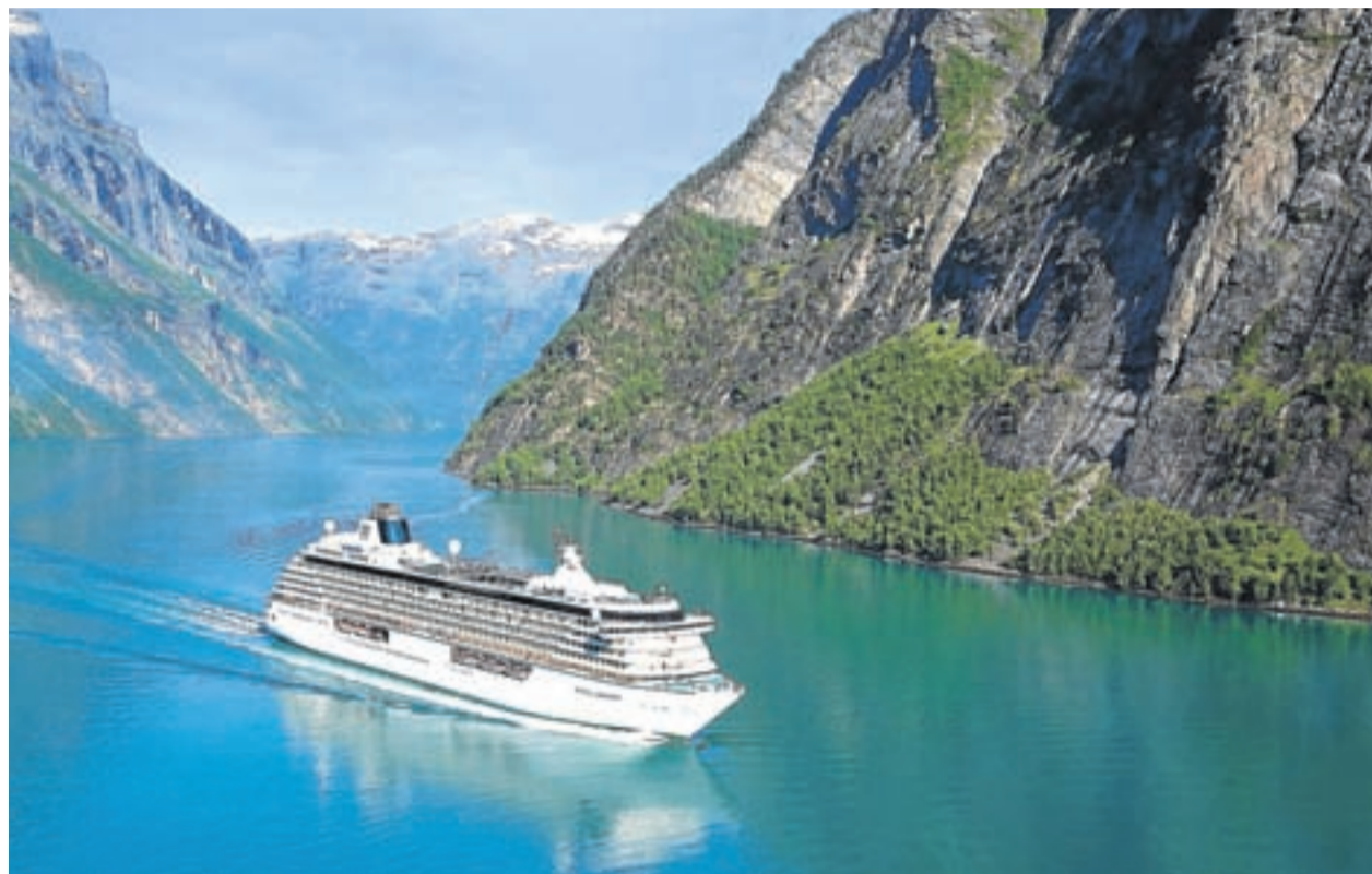
Un hotel de alto nivel por mar. Imagen del Serenity , que este año celebra el 25 aniversario de la compañía Crystal Cruises.

EL TAMAÑO SÍ IMPORTA. Lejos de ser megaciudades flotantes (el Serenity tiene casi 69.000 toneladas y capacidad para 1.070 viajeros, mientras que su hermano acoge a 922 huéspedes), su tamaño medio combina el servicio de alto nivel que distingue a las compañías de lujo, a la par que una variedad de entretenimiento y servicios imposible de hallar en buques pequeños. Espectáculos de calidad y formato medio en el Galaxy Lounge y baile, recitales o charlas en el Stardust Club, cine en el Hollywood Theatre, la pequeña discoteca Pulse, una fabulosa biblioteca y mediateca donde se prestan CD y DVD gratuitos para ver en el camarote, 11 espacios donde satisfacer el paladar (de la cena formal al helado premium ), un casino, amplio gimnasio, espá y salón de belleza, dos pistas de pádel tenis... Pero también ofertas culturales únicas, como las clases que imparten gratuitamente en la Computer University@Sea, las de cocina, arte, música, idiomas... con instructores de Yamaha o Berlitz, que avalan la calidad. Hubert Buelacher, director de hotel del Serenity , destaca que su combinación única de entretenimiento -con ocio y cultura- en un barco de lujo, junto con su reputada gastronomía y servicio es la fórmula que distingue a Crystal del resto