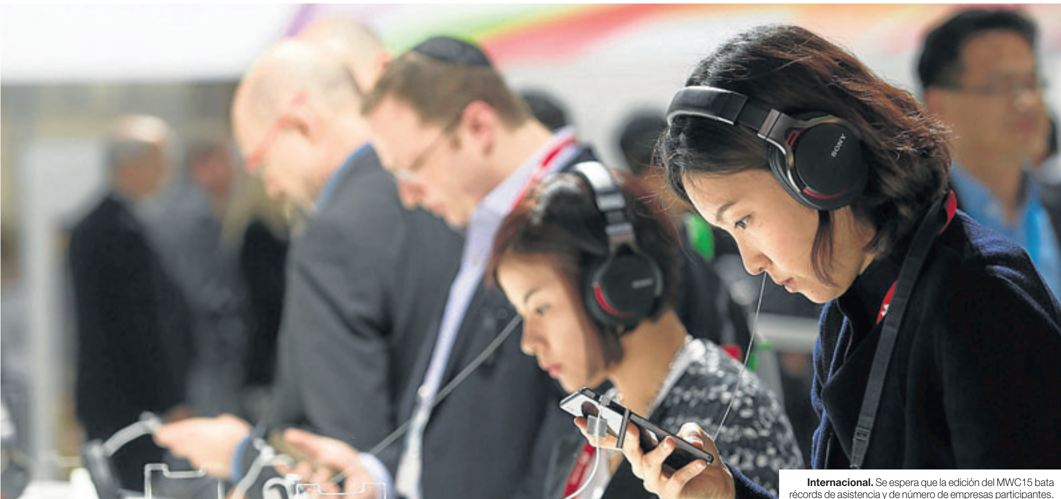
Internacional. Se espera que la edición del MWC15 bata récords de asistencia y de número de empresas participantes.

La organización califica de "anfitriona magnífica" a la ciudad de Barcelona, que hace que el evento sea un éxito año tras año