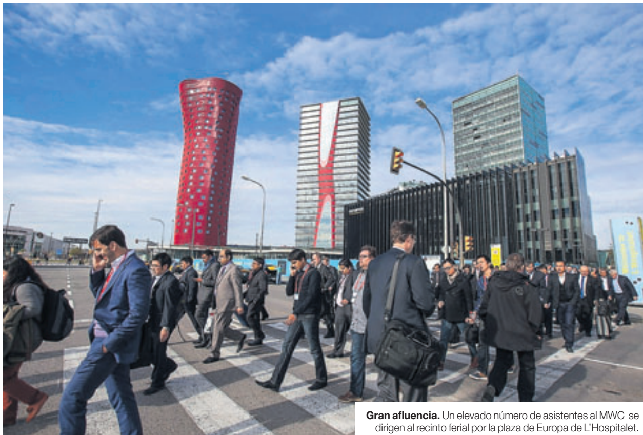
Gran afluencia. Un elevado número de asistentes al MWC se dirigen al recinto ferial por la plaza de Europa de L'Hospitalet.

CENTRO DE NEGOCIOS. Además de generar oportunidades de formación y de generar empleo, el MWC tiene la capacidad de situar L'Hospitalet en el epicentro de la innovación mundial y de mostrar su potencial de dinamización económica. La imagen que se ha escogido para dar la bienvenida a los visitantes juega con los emoticonos, los populares símbolos gráficos utilizados en mensajería móvil que reproducen expresiones faciales y sentimientos. En este caso la cara de alegría por recibir a los asistentes al Mobile World Congress y consolidar la apuesta de la ciudad como centro de negocios.