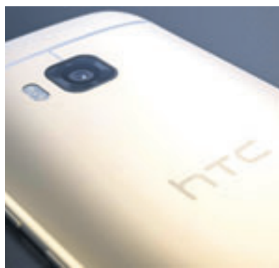
HTC. Imagen filtrada del M9.

Además del M9, que se posiciona en el segmento alto de precios, la marca podría dar a conocer un nuevo terminal ubicado en la gama media y cuya denominación sería One M8i. Este modelo incluiría algunas características del exitoso M8 que la compañía lanzó en la anterior edición del Mobile World Congress. Todo apunta a que el M8i llegaría con una pantalla de 5 pulgadas