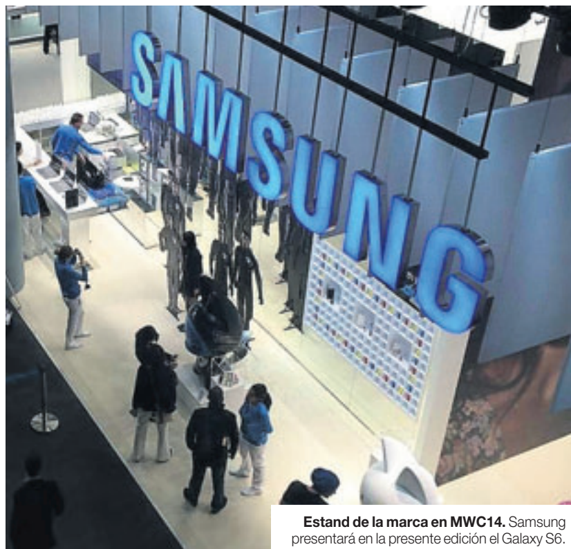
Estand de la marca en MWC14. Samsung presentará en la presente edición el Galaxy S6.

El S6, según todos los datos disponibles, tendrá una cámara frontal muy mejorada (de 5 megapíxeles) dada la fuerte tendencia al uso de esta en los móviles actuales. Se prevé que, respecto a la cámara trasera, se incluya un sensor con estabilización de imagen óptica, y en cuanto a la capacidad, que ascienda a los 20 megapíxeles.