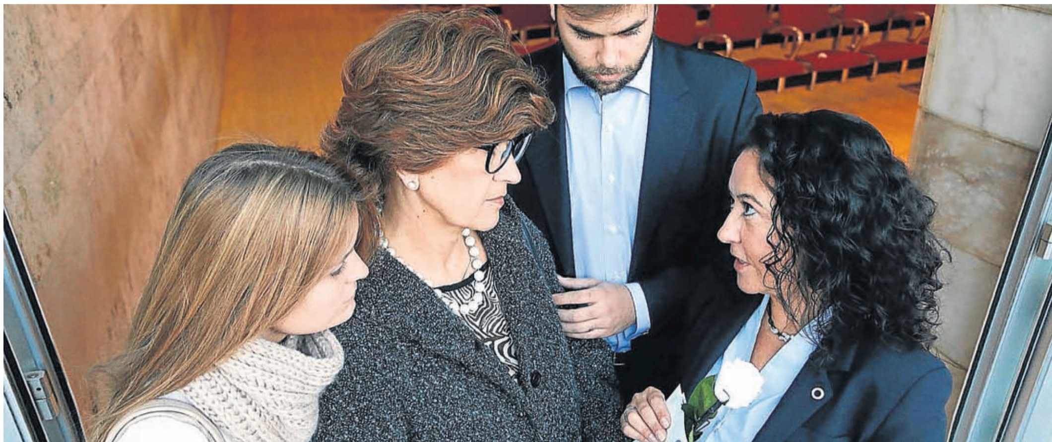
Planificar. Tenerlo todo decidido permite que la familia solo se ocupe de los suyos y evitar preocuparse por decisiones y trámites.

POR Lluís Muñoz Pandiella | MONOGRÁFICOS