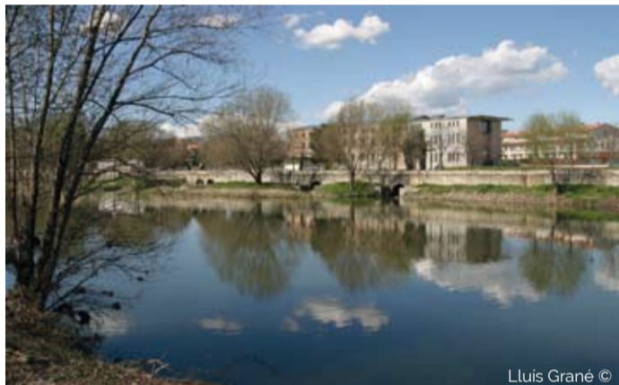
Exterior del Museo del Ter

La leyenda de la serpiente nos habla de un animal feroz que vivía en el bosque de la Devesa. Esta serpiente lucía un diamante que sólo se quitaba cuando se abrevaba en el río Ter a su paso por Manlleu. Un buen día, un niño robó el diamante y la fiera comenzó a perseguirlo por calles y plazas de Manlleu, comiéndose todo lo que se le cruzaba por delante. No os contaré el final de la historia, ya que os