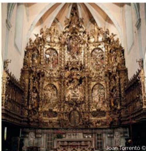
Joan Torrentó ©

Para asistir a las rutas hay que apuntarse en la Oficina de Turisme por correo electrónico a turisme@arenysdemar.cat o llamando al teléfono 937 957 039.