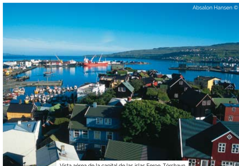
Vista aérea de la capital de las islas Feroe, Tórshavn