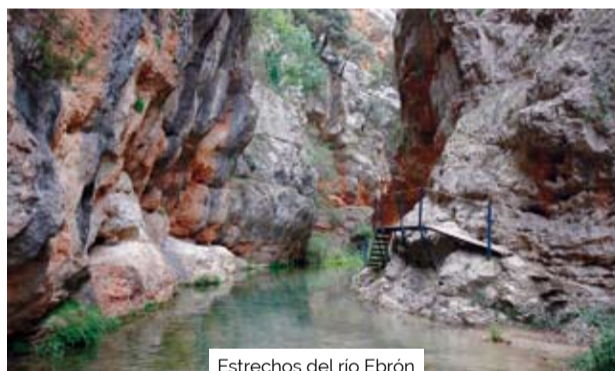
Estrechos del río Ebrón