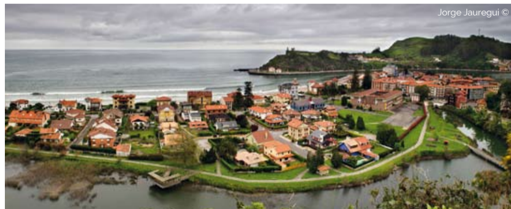
Jorge Jauregui ©

Portiellu, la antigua entrada de la villa, existe una ruta de gran interés arquitectónico, bien por el sabor popular de los edificios del Portiellu, la calle Oscura y la calle Infante, o por el aire señorial de las partes más céntricas, cuyos edificios más notables corresponden a los siglos XVI, XVII y XVIII. En la playa hay excelentes ejemplos de palacetes de aire modernista o regional, levantados a comienzos del