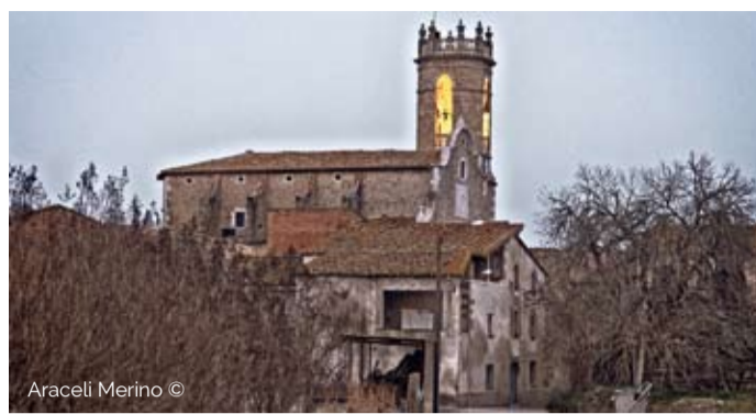
Araceli Merino ©