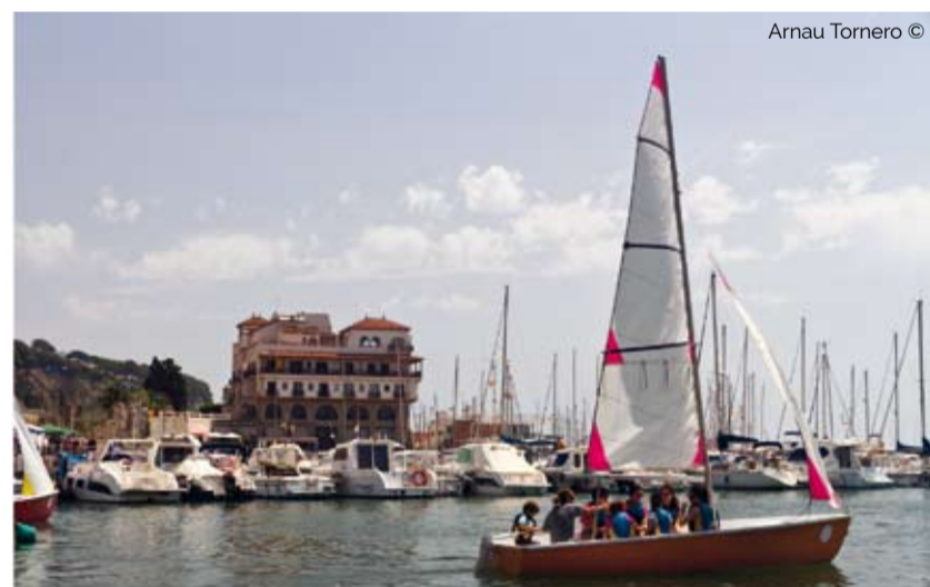
Arnau Tomero ©

pesca, salidas con pescadores de "sonso" o pesca familiar. Para la temporada veraniega dispone de un frente litoral de casi cuatro kilómetros entre los que destacan las playas del Cavaíó, la Picòrdia, les Roques d'en Lluc y la Musclera, las cuales ostentan el certificado EMAS reconociendo su buena gestión ambiental, todas con un elevado uso