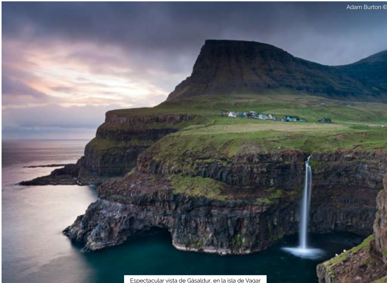
Espectacular vista de Gásaldur, en la isla de Vagar

El turismo de naturaleza cada vez gana más adeptos en nuestro país. Ya sean los glaciares y los géiseres de Islandia o las paradisíacas islas de Croacia, los viajeros cada día se sienten más atraídos por parques, ríos y zonas deshabitadas. Para todos aquellos, las islas Feroe emergen como un auténtico "must" : aun son pocos los que deciden visitar este archipiélago situado en el Atlántico Norte, y aquellos que lo hacen reciben como recompensa el gozar de unas tierras con una naturaleza espectacular y una cultura que no ha perdido ni un ápice su autenticidad, y todo ello sin apenas turistas.