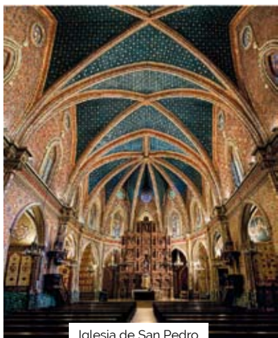
Iglesia de San Pedro

A 25 kilómetros de Teruel capital hay un espacio natural sujeto a visitas guiadas y en el que se programan actividades de educación ambiental. En la parte de Cella, a tan solo 17 kilómetros de la ciudad, merece la pena visitar la Fuente de Cella, un gran pozo artesiano construido en el siglo XII, uno de los más grandes, amplios y profundos de Europa.