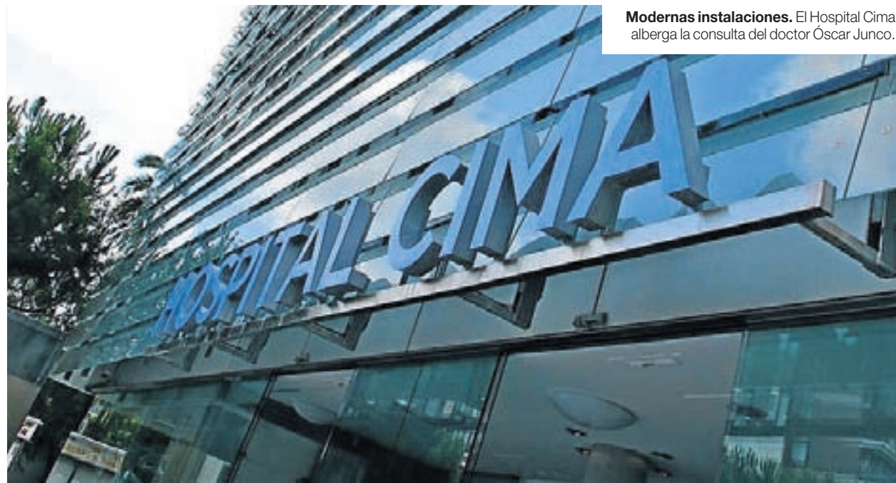
Modernas instalaciones. El Hospital Cima alberga la consulta del doctor Óscar Junco.

DUDAS MÁS COMUNES. Antes de someterse a una operación de cirugía plástica y estética, conviene despejar algunas dudas. Entre las más comunes