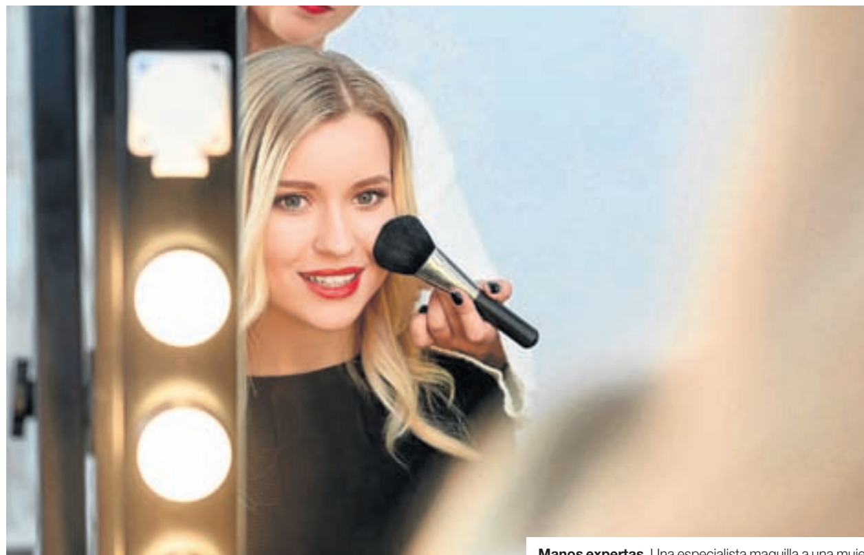
Manos expertas. Una especialista maquilla a una mujer.

HÁBITOS SALUDABLES. Una de las clínicas pioneras en este tratamiento integral en España es Dorsia ( www.dorsia.es ). Desde Minerva, su unidad de Nutrición y Obesidad, se llevan a cabo tres técnicas de cirugía bariátrica, desde la más clásica de introducción de balón gástrico, pasando por la manga gástrica hasta llegar al llamado Método Pose, de cirugía no invasiva. Este último consiste en la introducción vía oral de miniinstrumentación con el fin de reducir la parte