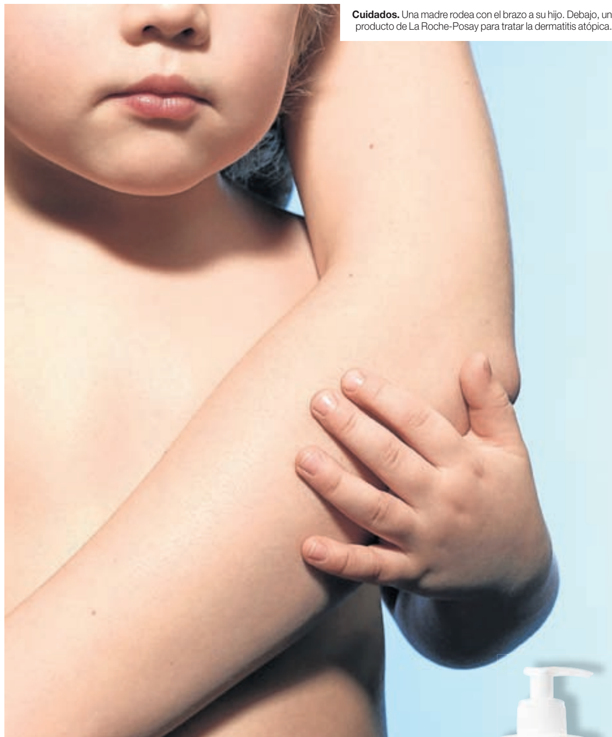
Cuidados. Una madre rodea con el brazo a su hijo. Debajo, un producto de La Roche-Posay para tratar la dermatitis atópica.