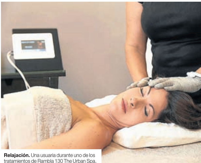
Relajación. Una usuaria durante uno de los tratamientos de Rambla 130 The Urban Spa.