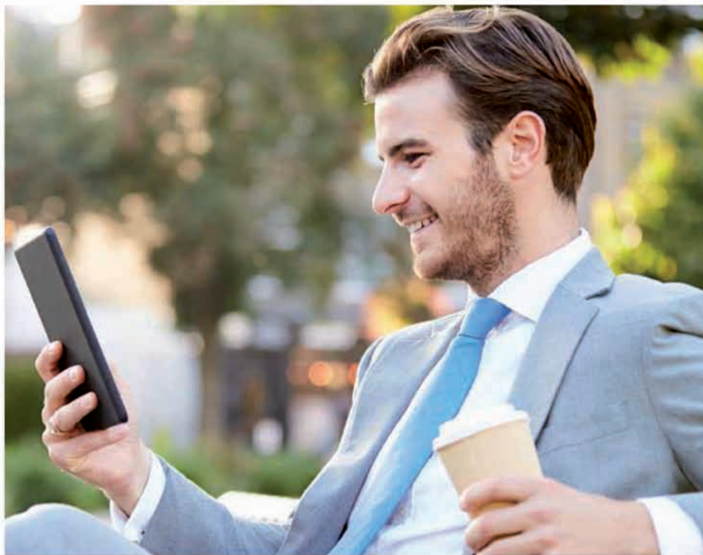
L'Escola de l'Aigua transfereix un coneixement actualitzat i connectat amb la realitat professional AIGÜES DE BARCELONA

El màster incorpora tres elements innovadors principals: un aprenentatge basat 100% en reptes professionals on l'alumne ha de proposar una solució a una situació real. Com a la vida, no hi ha una solució única, per això l'expert recomana una solució fonamentada en la seva experiència i en els recursos disponibles en aquest cas en concret, però les solucions innovadores i imaginatives són molt valorades.