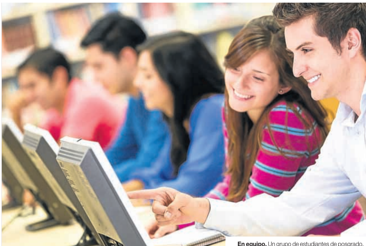
En equipo. Un grupo de estudiantes de posgrado.

POR COMUNIDADES. Según el mencionado informe, la distribución geográfica de la oferta de empleo que solicita estudios de posgrado sufrió cambios el año pasado. En el reparto de porcentajes por comunidades autónomas, Catalunya, Andalucía y Madrid ocupan las primeras posiciones, con valores próximos al 8% de las ofertas de empleo que solicitan tener estudios de posgrado. Le siguen Castilla y León (6,6%), País Vasco (5,6%) y Galicia (5,5%). En el otro extremo se sitúan Ceuta y Melilla, La Rioja, Asturias, Ba-