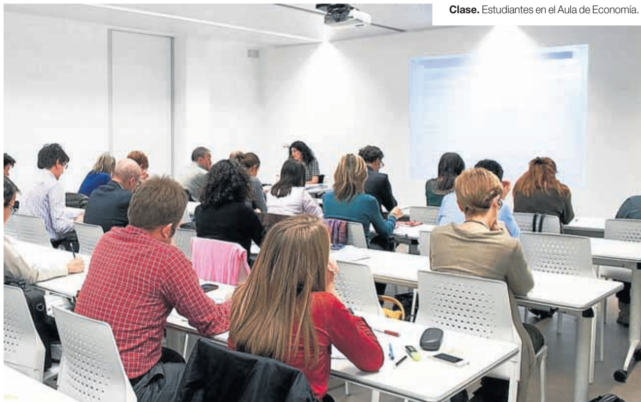
Clase. Estudiantes en el Aula de Economía.