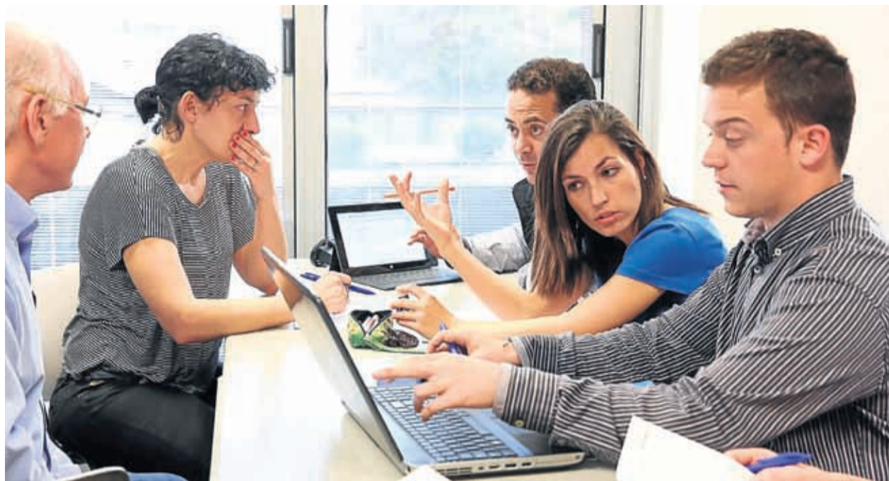
Experiencia compartida. Estudiantes de La Salle Campus Barcelona-URL realizan un trabajo en grupo.

Desde La Salle se está potenciando el área de Digital Business en sus programas de másteres y posgrados para ins-