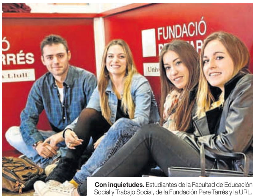
Con inquietudes. Estudiantes de la Facultad de Educación Social y Trabajo Social, de la Fundació Pere Tarrés y la URL.

El claustro del profesorado del máster está formado por profesionales en activo que, desde una perspectiva multidisciplinar, desarrollan un modelo de