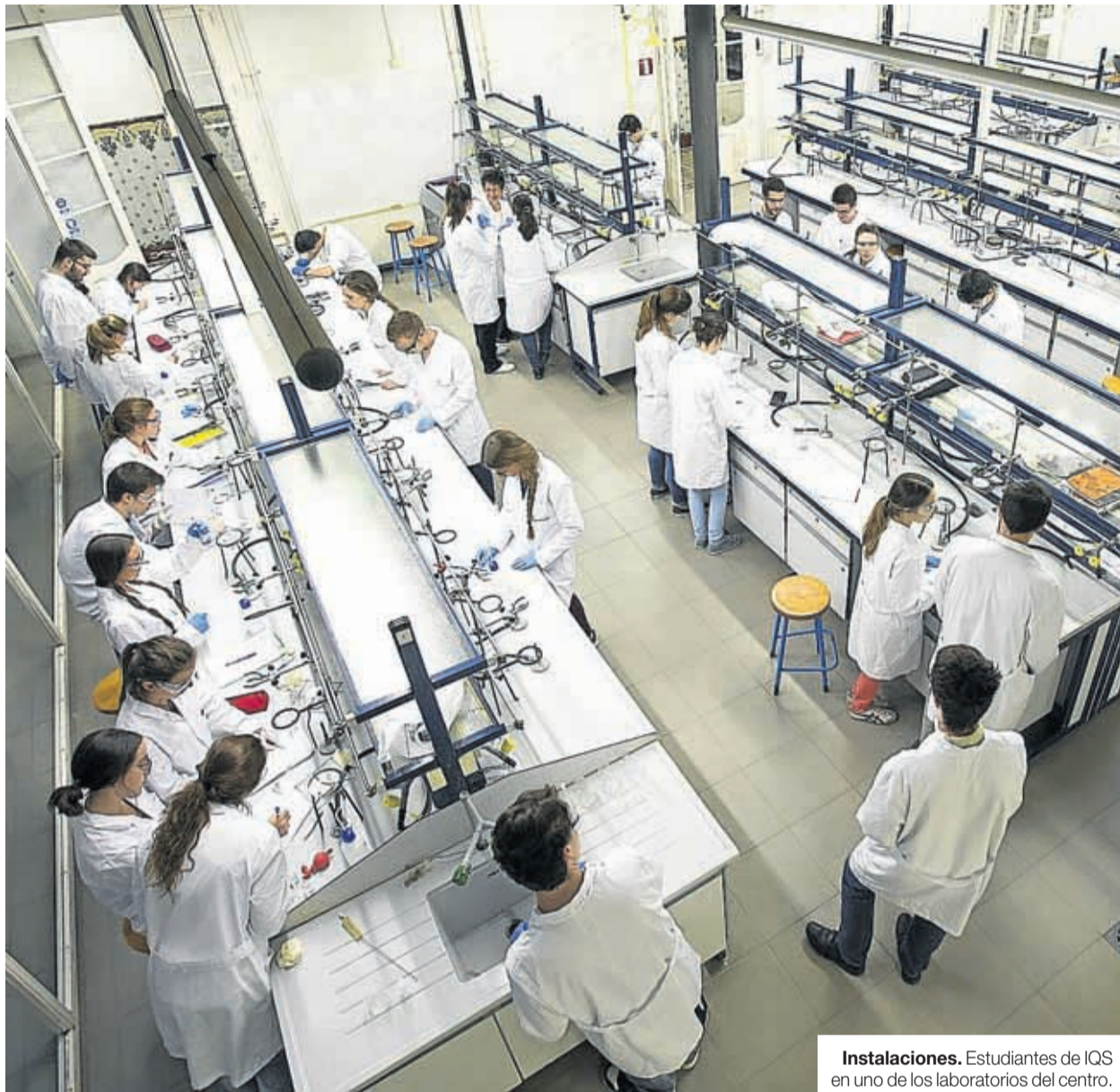
Instalaciones. Estudiantes de IQS en uno de los laboratorios del centro.