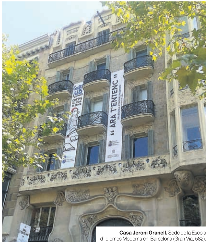
Casa Jeroni Granell. Sede de la Escola d'Idiomes Moderns en Barcelona (Gran Via, 582).