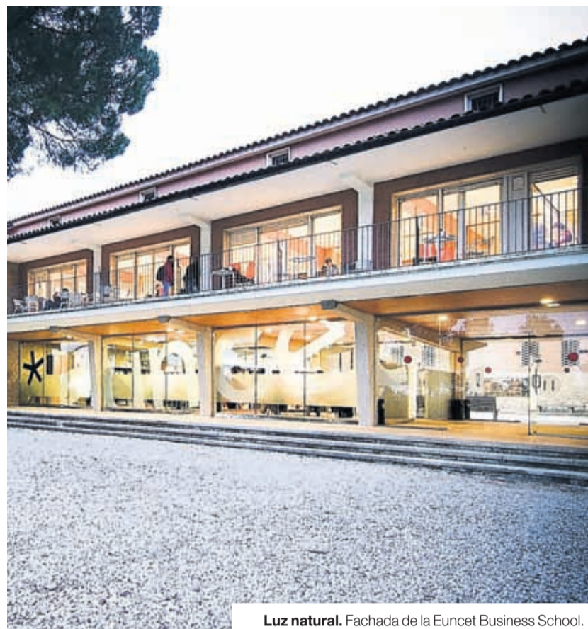
Luz natural. Fachada de la Euncet Business School.