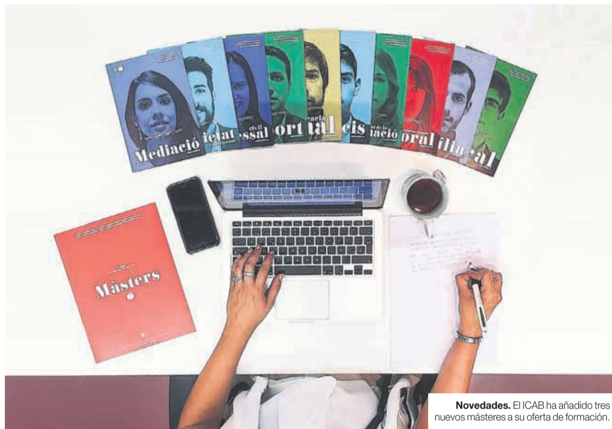
Novedades. El ICAB ha añadido tres nuevos másteres a su oferta de formación.

La metodología de trabajo permite a los alumnos alcanzar las capacidades específicas que los habilitarán para la dedicación en el área de derecho escogida. La característica principal de los másteres es que las sesiones son eminentemente prácticas y se llevan a cabo en horarios compatibles con el ejercicio de la abogacía. Las clases se realizan en grupos de trabajo reducidos, lo que facilita el aprendizaje y la interacción con los profesores, así como la atención personalizada al alumno, que tiene como pieza destacada la posibilidad de hacer prácticas en despachos. Todos los profesores son abogados en ejercicio, expertos en la materia impartida. Hace más de una década que el