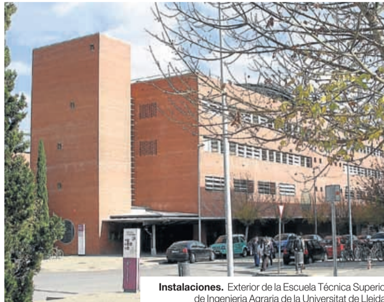
Instalaciones. Exterior de la Escuela Técnica Superior de Ingeniería Agraria de la Universitat de Lleida.

Y un paso más allá es la incorporación de la formación dual en nuestros programas, una