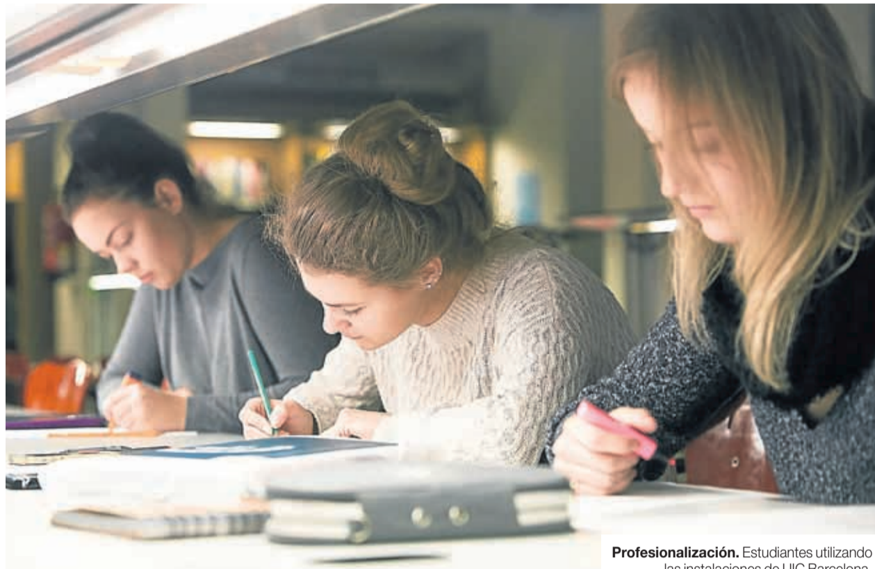
Profesionalización. Estudiantes utilizando las instalaciones de UIC Barcelona.