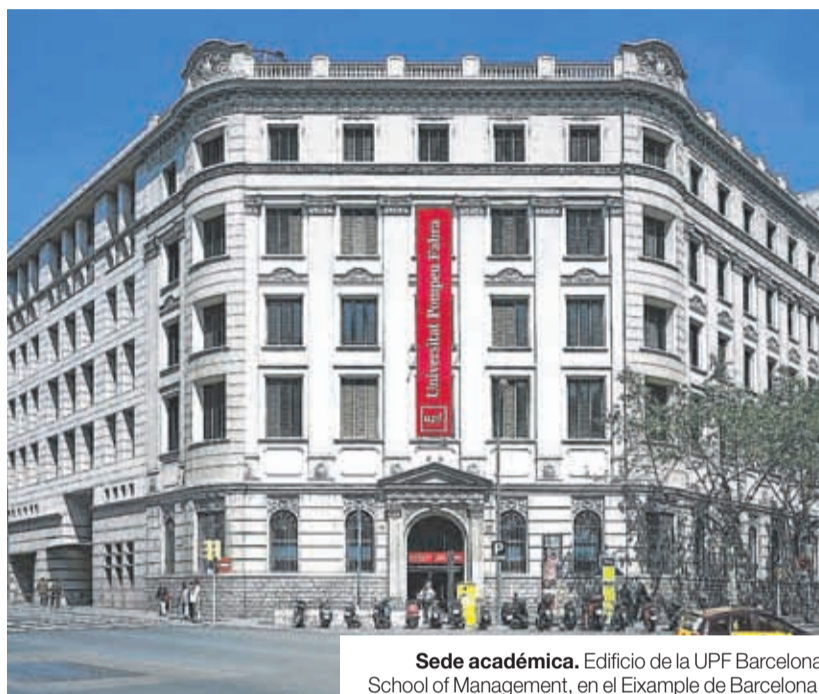
Sede académica. Edificio de la UPF Barcelona School of Management, en el Eixample de Barcelona.

PERSONALIZACIÓN. Conscientes de estar viviendo un tiempo de cambios profundos y de nuevas tendencias educativas, económicas y sociales, la UPF Barcelona School of Management está trabajando también