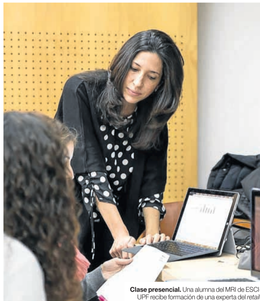
Clase presencial. Una alumna del MRI de ESCI-UPF recibe formación de una experta del retail.

El MRI es un máster con vocación multisectorial que celebra este año su décimo aniversario