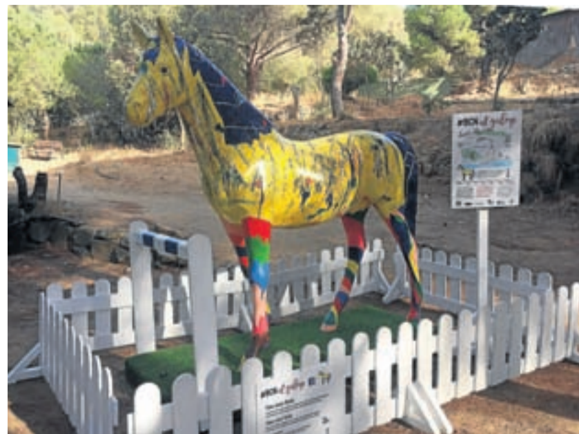
Estrella Fugaç. El caballo amarillo de fibra de vidrio estará expuesto en el Real Club de Polo.