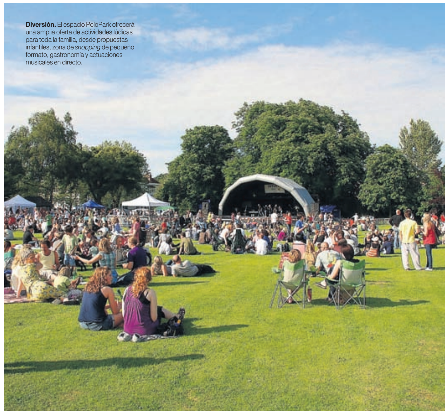
Diversión. El espacio PoloPark ofrecerá una amplia oferta de actividades lúdicas para toda la familia, desde propuestas infantiles, zona de shopping de pequeño formato, gastronomía y actuaciones musicales en directo.