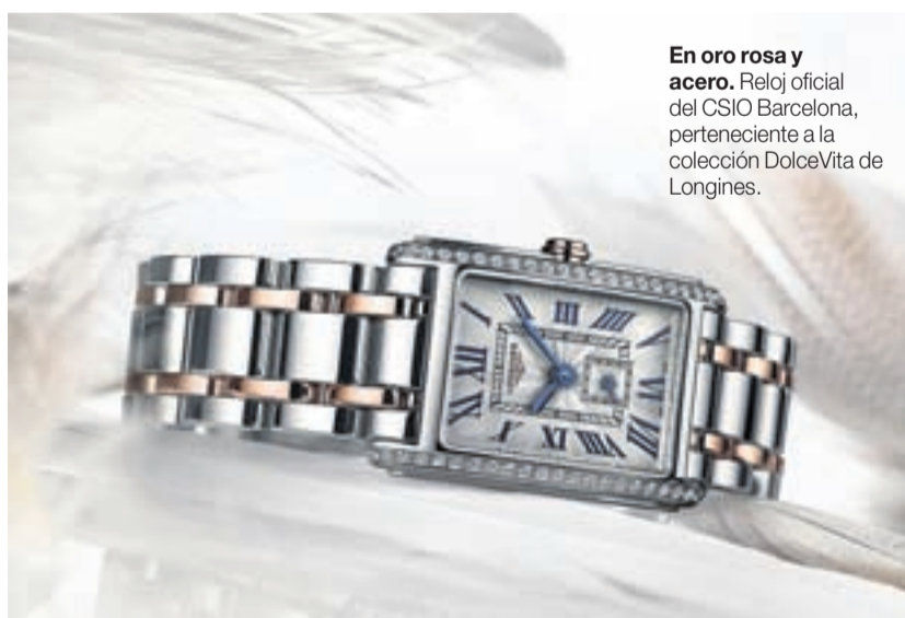
En oro rosa y acero. Reloj oficial del CSIO Barcelona, perteneciente a la colección DolceVita de Longines.

El CSIO Barcelona 2016 es la ocasión perfecta para descubrir la colección Longines DolceVita, que refleja la elegancia contemporánea de la marca relojera Longines en todo el mundo. El reloj oficial del evento es un modelo de señora en oro rosa y acero de esta colección, con una sólida corona de oro rosa engastada con diamantes que