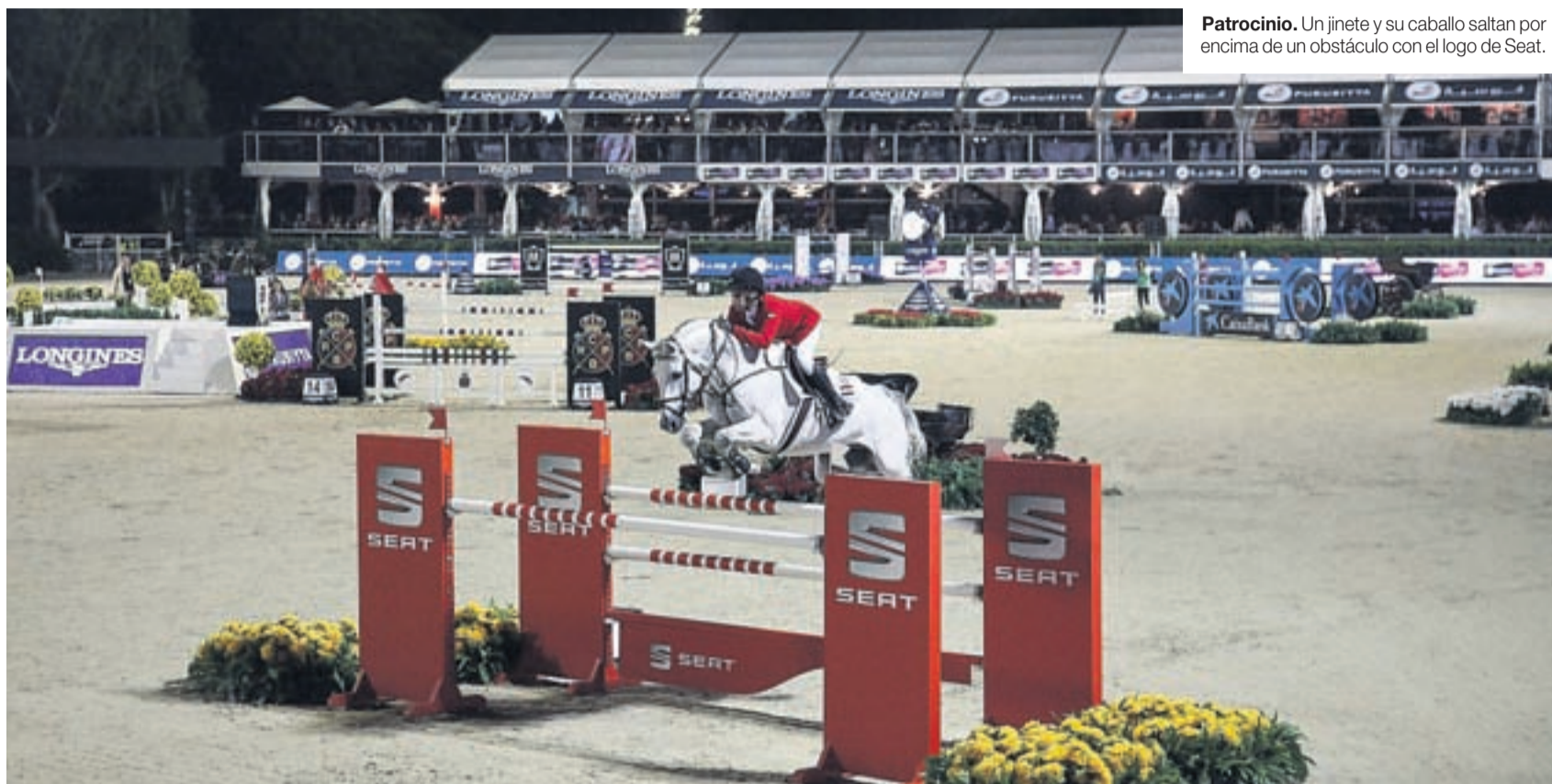
Patrocinio. Un jinete y su caballo saltan por encima de un obstáculo con el logo de Seat.

EPICENTRO. Este acontecimiento excepcional se enmarca dentro de la Barcelona Equestrian Challenge, uno de los momentos más esperados del año para los amantes de la equitación y