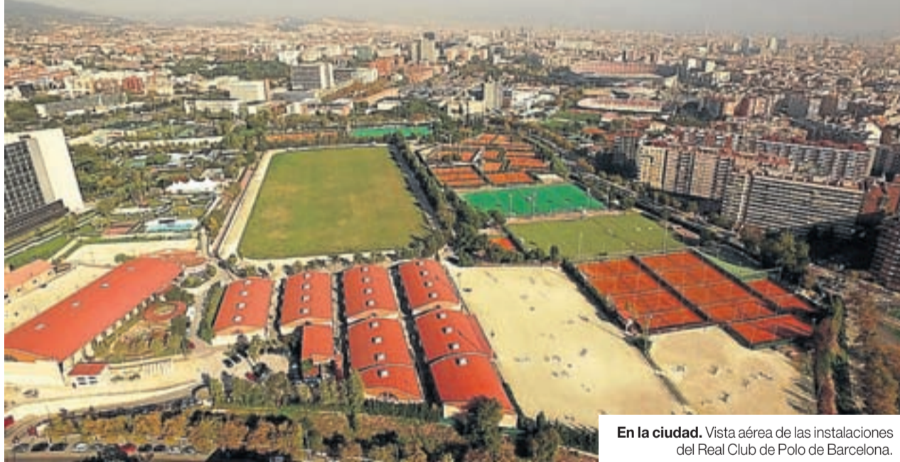
En la ciudad. Vista aérea de las instalaciones del Real Club de Polo de Barcelona.

Pero todo ello solo es posible con una base sólida en la que apoyarse. El mejor patrimonio del Polo está en sus socios más jóvenes. Prácticamente 2.000 niños y niñas de diferentes edades practican algún deporte en el club, y muchos de ellos lo hacen a nivel competitivo. El club combina la vocación de servicio a sus socios con la organización de eventos de máximo nivel. Además del CSIO Barcelona, el Estrella Damm Barcelona Master de Pádel, el Torneo Internacional de Hockey de Reyes, el Torneo de la Inmaculada, el Barcelona Polo Challenge – Negrita Cup o el ITF Senior de Tennis (con el grado máximo que otorga la Federación Internacional) se organizan en la entidad. ★