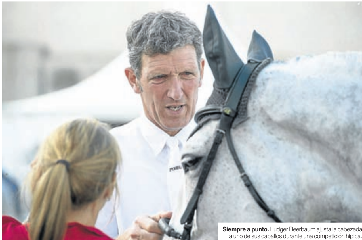
Siempre a punto. Ludger Beerbaum ajusta la cabezada a uno de sus caballos durante una competición hípica.

-La relación que se establece entre el jinete y su caballo resulta muy especial. Con su experiencia como uno de los grandes en la hípica, ¿quién es más importante, el caballo o el jinete? ¿O se trata de una responsabilidad compartida al 50%?