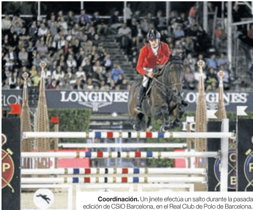
Coordinación. Un jinete efectúa un salto durante la pasada edición de CSIO Barcelona, en el Real Club de Polo de Barcelona.

Además de las tres pruebas por equipos (la primera calificativa, la Longines Challenge Cup y la Gran Final Furusiyya), el CSIO Barcelona 2016 completa su programa de competiciones con otras seis pruebas individua-