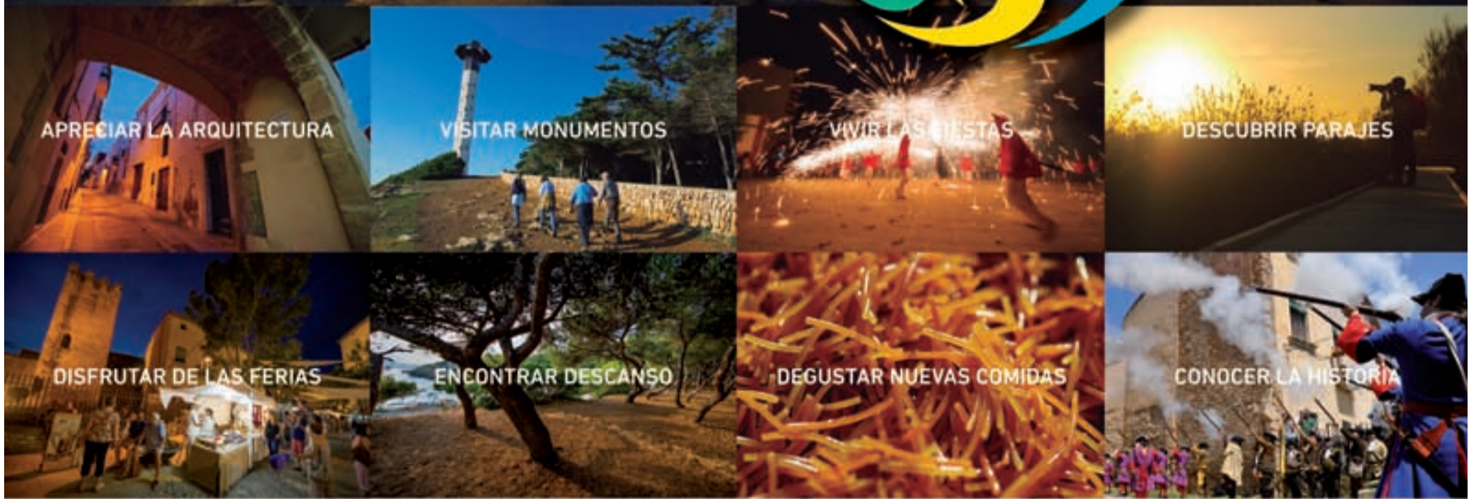
APRECIAR LA ARQUITECTURA