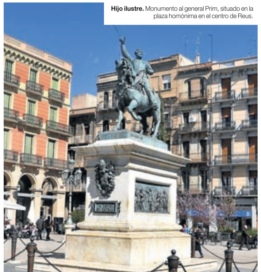
Hijo ilustre. Monumento al general Prim, situado en la plaza homónima en el centro de Reus.

Como ocurre en todo núcleo urbano, la mejor manera de conocer Reus es caminando por sus calles, dejándose llevar por el azar para acabar, por ejemplo, en la Plaça Prim, la Plaça del Mercadal o el barrio antiguo. Es aquí donde vemos en primera persona el vitalismo