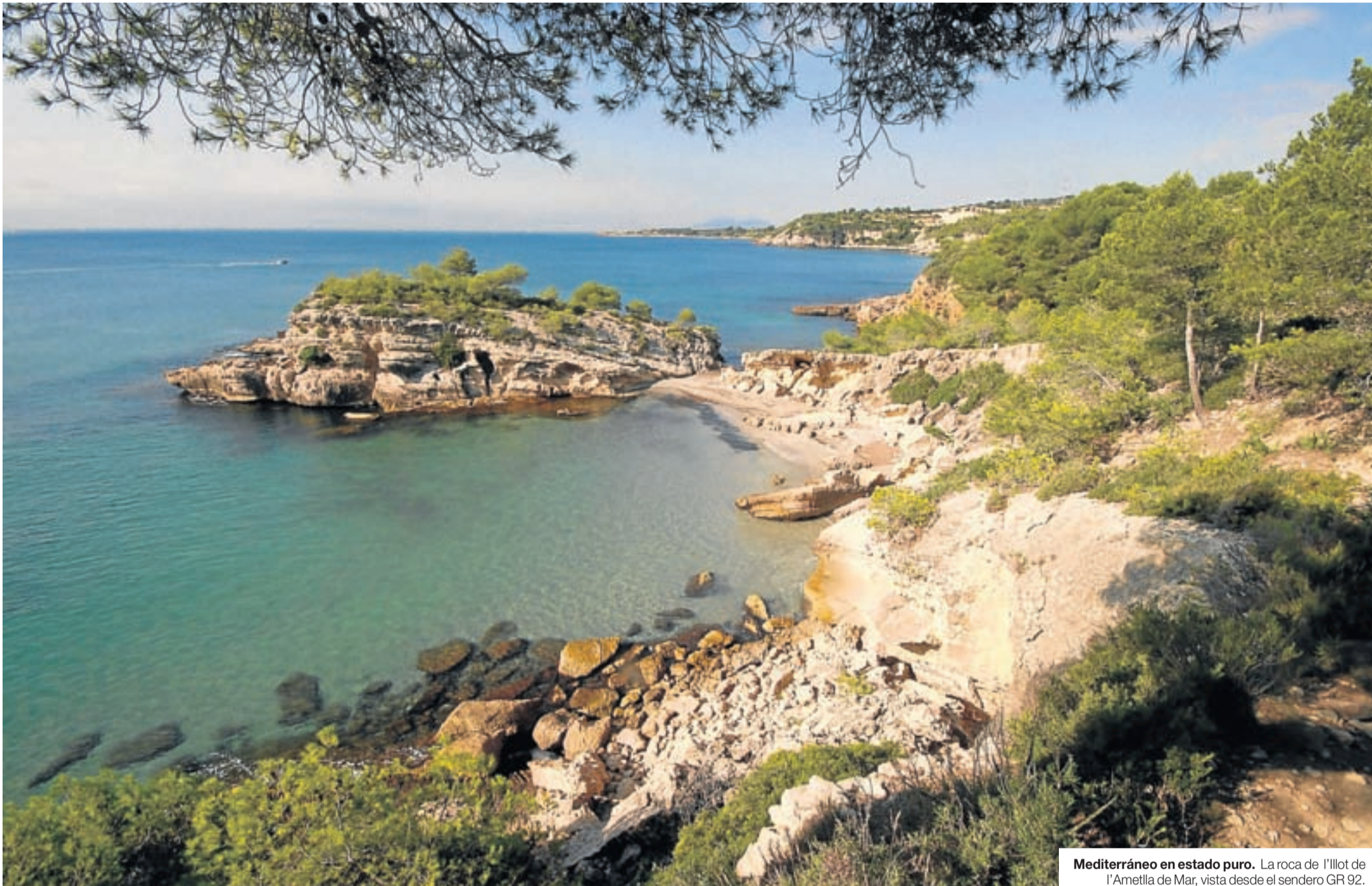
Mediterráneo en estado puro. La roca de l'Illot de l'Ametlla de Mar, vista desde el sendero GR 92.