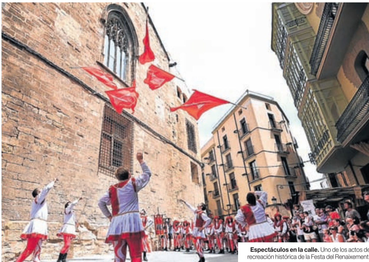
Espectáculos en la calle. Uno de los actos de recreación histórica de la Festa del Renaixement.

TODO EL AÑO. Pero como existe una Tortosa eterna más allá de la Festa del Renaixement, el visitante que acuda en cualquier época del año puede visitar la majestuosa catedral de Santa Maria, que además acoge la exposición permanente con fondos propios de la Sede. Desde aquí se puede acceder tras un corto paseo a pie al Palacio Episcopal, para muchos el más hermoso