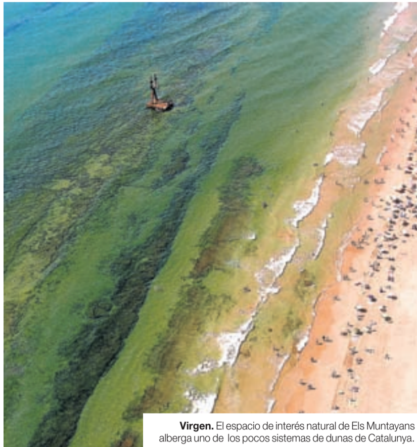
Virgen. El espacio de interés natural de Els Muntanyans alberga uno de los pocos sistemas de dunas de Catalunya.

ESPACIO DE DIVULGACIÓN. La experiencia de contacto con la naturaleza se puede ampliar, además, visitando Can Bofill, un antiguo chalet construido por una de las primeras familias veraneantes de Torredembarra.